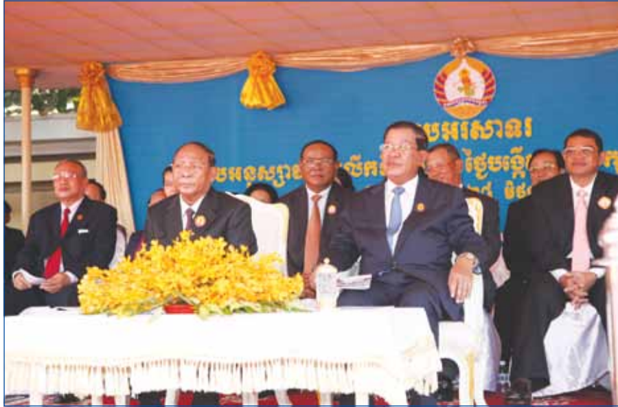
គណៈអធិបតីនៃអង្គមិទ្ធិព្យ