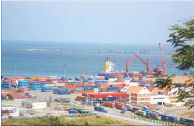
សកម្មភាពលើកដាក់ទំនិញនាំចេញ-នាំចូល នៅកំពង់ផែស្វយ័តខេត្តព្រះសីហនុ

* ឥទ្ធិពលនៃការនាំចេញ-ចូល ត្រឹមមានទឹកមួយដើមឆ្នាំ ២០១៤ កើន ១៥%