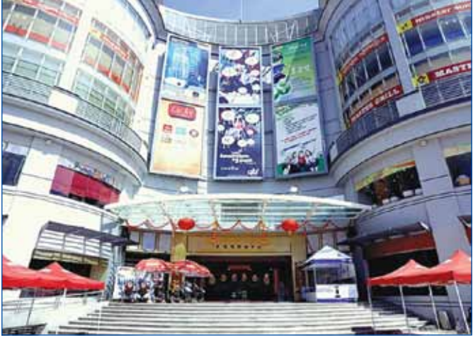
ផ្សារទំនើបសុវណ្ណានៅរាជធានីភ្នំពេញ

បើធៀបនឹងរយៈពេលដូចគ្នាឆ្នាំ ២០១៣ ។ ដោយឡែក ពាណិជ្ជកម្ម កម្ពុជា អាមេរិក តាមទិន្នន័យចុងក្រោយបង្ហាញថា ការស្ទុះងើបឡើង វិញនៃសេដ្ឋកិច្ចអាមេរិក បានជំរុញឱ្យការនាំចូលពីកម្ពុជា បានកើន ឡើង ១១ % ក្នុងអំឡុងត្រីមាសទី ១ នៅឆ្នាំនេះ ។ ការនាំចូលរបស់ អាមេរិកពីកម្ពុជាមានតម្លៃសរុប ៧៧១ លានដុល្លារនៅចុងខែមីនា កើនឡើងពី ៦៩៤ លានដុល្លារក្នុងរយៈពេលដូចគ្នាកាលពីឆ្នាំមុន ។ លទ្ធផលនេះបានធ្វើឱ្យកម្ពុជាស្ទុះឡើងដល់ចំណាត់ថ្នាក់ទី ៥៨ នៅលើ បញ្ជីនៃបណ្តាប្រទេសដែលនាំចូលទៅអាមេរិក ។/