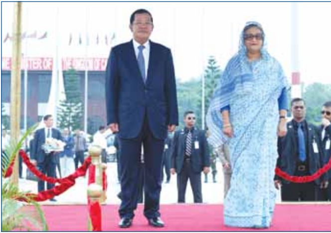
លោកជំទាវ ហ្សេន ហាន់ស៊ីណា ទទួលស្វាគមន៍យ៉ាងកក់ក្តៅចំពោះ សម្តេចអគ្គមហាសេនាបតីតេជោ ហ៊ុន សែន