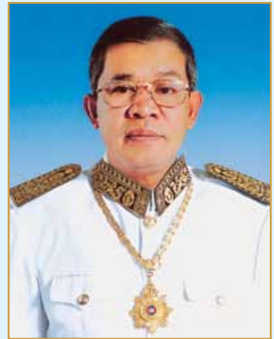
សម្តេចអគ្គមហាសេនាបតីតេជោ