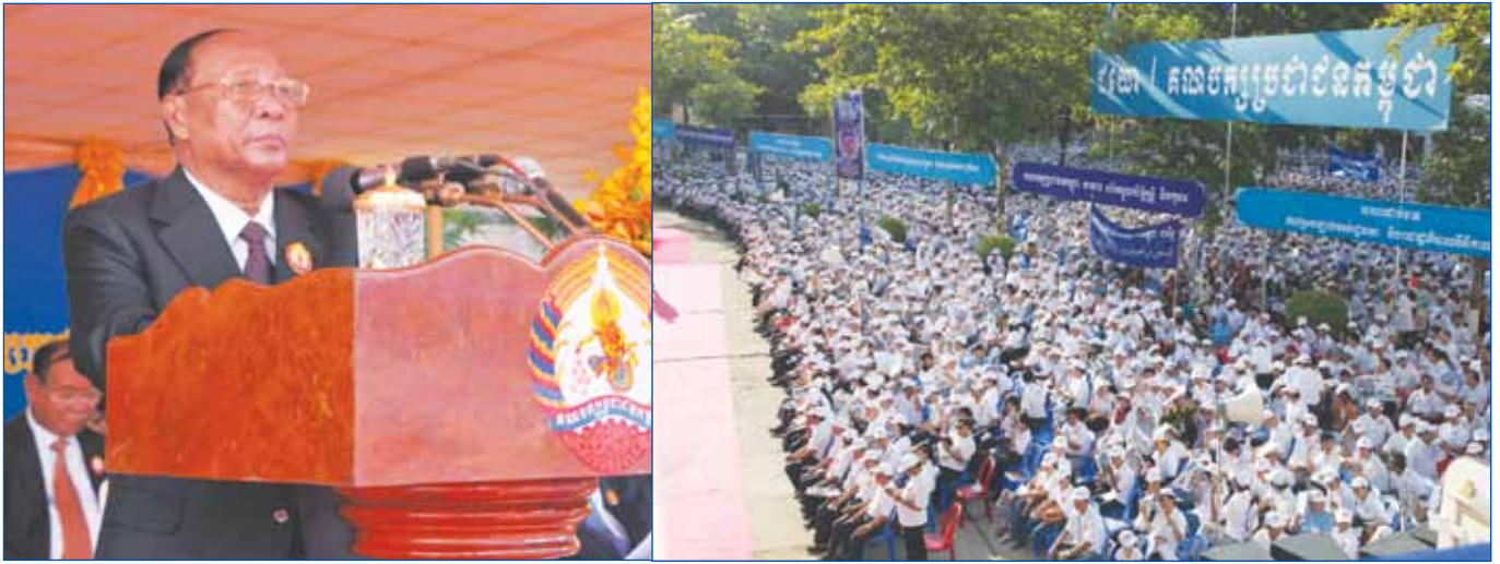
សម្តេចអគ្គមហាសេនាបតីតេជោ សំរិន ថ្លែងសុន្ទរកថាទៅកាន់អង្គមិទ្ធិព្យ

ជិត អាជីវករ ព្រះសង្ឃ បញ្ជីនៃគ្រប់សាសនា គ្រប់ជនជាតិ មន្ត្រីរាជការ និងកងកម្លាំងប្រដាប់អាវុធ គ្រប់ប្រភេទ ដែលកំពុងចូលរួមអនុវត្តយ៉ាងសកម្ម នូវកម្មវិធីនយោបាយរបស់រាជរដ្ឋាភិបាល ដើម្បីបន្តកសាងការពារមាតុភូមិ និងលើកស្ទួយជីវភាពរស់នៅឱ្យបានកាន់តែប្រសើរឡើង ។