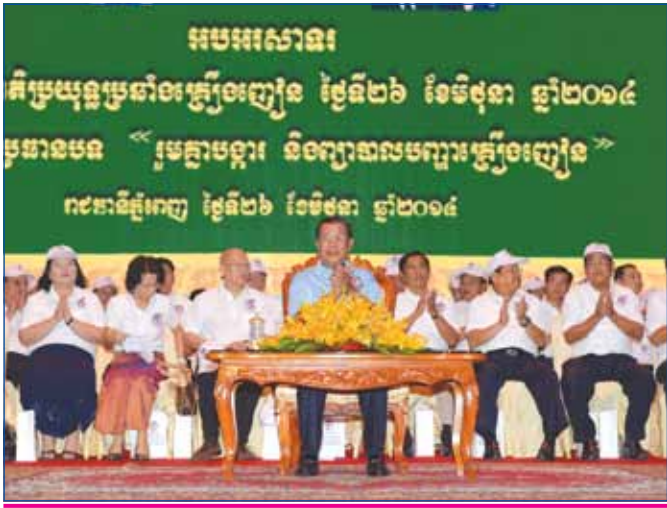
សម្តេចតេជោ ហ៊ុន សែន ក្នុងឱកាសអញ្ជើញជាអធិបតីដ៏ខ្ពង់ខ្ពស់ ក្នុងទិវាអន្តរជាតិប្រយុទ្ធ ប្រឆាំងគ្រឿងញៀននៅកោះពេជ្រ

ហ្សឺបគេចាប់ប្រធានាធិបតីចេញពីការបោះឆ្នោត ហើយគេឡើងធ្វើប្រធានាធិបតីខ្លួនឯង ។ ឯយើងនេះចេញពីការបោះឆ្នោត ឈ្នះឆ្នោត ឆ្លងកាត់រដ្ឋសភា ព្រះមហាក្សត្របានតែងតាំង ម៉េចដោះស្រាយបញ្ហាមិនបាន? ។ លោកឯងចង់នៅខាងក្រៅនៅទៅ ព្រោះនៅស្រុកខ្មែរពុំមានច្បាប់ឱ្យសែងលោកឯងចូលរដ្ឋសភាទេ ។ លោកឯងនៅខាងក្រៅនៅទៅ តែកុំមកបន្ទោសគេ ហើយបបួលគេឱ្យបោះឆ្នោតឡើងវិញ ។