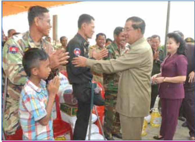
សម្តេចតេជោ ហ៊ុន សែន និងសម្តេចកិត្តិព្រឹទ្ធបណ្ឌិត ប៊ុន រ៉ានី ហ៊ុន សែន ក្នុងឱកាសអញ្ជើញជួបសំណេះសំណាលជាមួយយោធិនពិការនៅមណ្ឌលជនពិការ ៣១៧ តាកែនកោះស្នា ស្ថិតនៅភូមិតេជោអភិវឌ្ឍន៍ ឃុំតេជោអភិវឌ្ឍន៍ ស្រុកឈូក ខេត្តកំពត

ពាក់ព័ន្ធនឹងទង្វើរបស់គណបក្សប្រឆាំងដែលបង្កភាពស្មាកស្មាញមិន ចេះចប់តាំងពីក្រោយការបោះឆ្នោតមកនោះ សម្តេចបានបញ្ជាក់ថា " អស់ លោកឱ្យល្មមកុំចង់សាក។ បណ្តោយលោកឯងប៉ុន្មានរយៈមកហើយ។ លោកល្មមបានហើយ។ បើលោកចង់ដឹង តម្រូវការតែ ៤៨ ម៉ោងទេគ្រប់