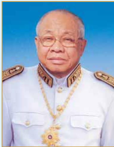
សម្តេចអគ្គមហាសេនាបតីតេជោ