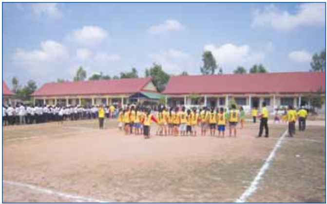
ការប្រកួតកីឡារបស់សិស្សានុសិស្សនៃសាលារបស់សិក្សាជីប្រាជ្ញា ក្នុងស្រុកកំពង់ត្រឡាច ខេត្តកំពង់ឆ្នាំង

ជាមួយនឹងការវិវត្តច្រើនទាំងនេះ ក្រសួងអប់រំ យុវជន និងកីឡាក៏នៅមានបញ្ហាប្រឈមជាច្រើនទៀតដែលត្រូវពុះពារបន្តដោះស្រាយដូចជាបញ្ហាកង្វះគ្រូមត្តេយ្យសិក្សារដ្ឋ កង្វះគ្រូមធ្យមសិក្សាទុតិយភូមិនិងមធ្យមសិក្សារបស់ភូមិធានាមុខវិជ្ជាកម្មមួយចំនួននៅតាមវិទ្យាល័យ និងអនុវិទ្យាល័យដែលបង្កើតថ្មី ពិសេសនៅតំបន់ជួបការលំបាកកង្វះគ្រូកម្រិតខ្ពស់នៃសាលាបឋមសិក្សា គ្រូកម្រិតខ្ពស់សម្រាប់អនុវិទ្យាល័យអប់រំបច្ចេកទេស និងបំណិនជីវិត កង្វះគ្រូ និងបណ្ណារក្សនៅតំបន់ដាច់ស្រយាល និងសម្រាប់ការងារអប់រំក្រៅប្រព័ន្ធ ។ ក្រៅពីនេះក៏នៅមានកង្វះការបំប៉នជំនាញទំនាក់ទំនងដែលឆ្លើយតបទៅនឹងតម្រូវការរបស់យុវជន កង្វះព័ត៌មាន និងសមត្ថភាពជំនាញក្នុងការស្វែងរកការងារ និងការបង្កើតមុខរបររបស់យុវជនជាដើម ។