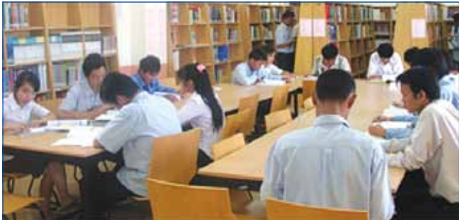
សិស្ស និស្សិត កំពុងសិក្សាស្រាវជ្រាវឯកសារក្នុងបណ្ណាល័យ