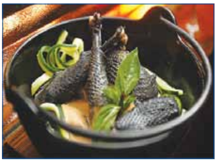
សាច់មាន់ខ្មៅ ត្រូវបានគេចាត់ទុកថាជាសាច់បក្សីដ៏ប្រពៃសម្រាប់ប្តូរសុខភាព

"មាន់ខ្មៅ" ជាបក្សីមានស្លាប់តែហើរមិនរួចនេះ