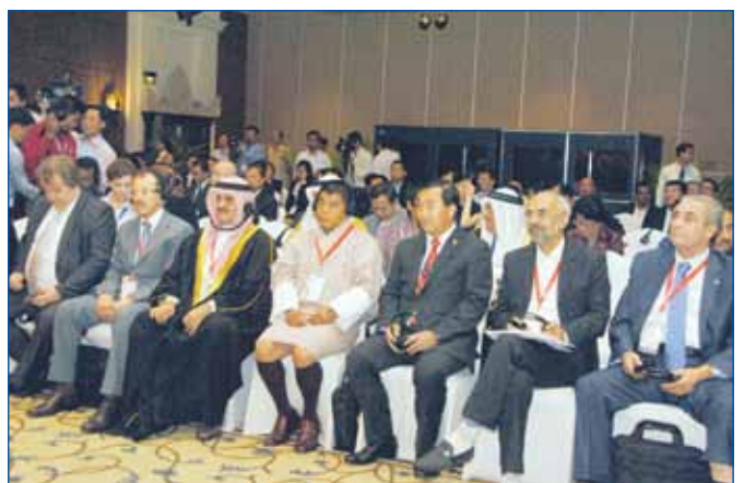
សមាជិក សមាជិកា ចូលរួមក្នុងកិច្ចប្រជុំគណៈកម្មាធិការចំពោះកិច្ចរបស់សភាតំបន់អាស៊ី ដែលហៅកាត់ថា APA

ឯកឧត្តម ឃ្យួល ខ្មៅ ប្រធានគណៈកម្មការទី ១ រដ្ឋសភា បានមានប្រសាសន៍នៅក្នុងសន្និសីទកាសែតក្រោយបញ្ចប់កិច្ចប្រជុំថា ការរៀបចំទទួលធ្វើជាម្ចាស់ផ្ទះកិច្ចប្រជុំគណៈកម្មាធិការចំពោះកិច្ចដែលទាក់ទងទៅនឹងលក្ខន្តិកៈ ឯកសារពាក់ព័ន្ធរបស់អគ្គលេខាធិការដ្ឋានអចិន្ត្រៃយ៍ និងបុគ្គលិកនិងហិរញ្ញវត្ថុរបស់សភានៃតំបន់