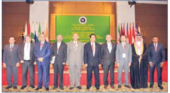
ឯកឧត្តម ខួន ឃ្យួល អញ្ជើញជាអធិបតីក្នុងកិច្ចប្រជុំគណៈកម្មាធិការចំពោះកិច្ចរបស់សភាតំបន់អាស៊ី ដែលហៅកាត់ថា APA ស្តីពីបទប្បញ្ញត្តិហិរញ្ញវត្ថុ និងការគ្រប់គ្រងបុគ្គលិកសម្រាប់អគ្គលេខាធិការដ្ឋានអចិន្ត្រៃយ៍របស់សភាក្នុងតំបន់អាស៊ី និងថតរូបអនុស្សាវរីយ៍

កាលពីព្រឹកថ្ងៃទី២៥ ខែមិថុនា ឆ្នាំ២០១៤ កិច្ចប្រជុំគណៈកម្មាធិការចំពោះកិច្ចរបស់សភាតំបន់អាស៊ី ដែលហៅកាត់ថា APA ស្តីពីបទប្បញ្ញត្តិហិរញ្ញវត្ថុ និងការគ្រប់គ្រងបុគ្គលិក សម្រាប់អគ្គលេខាធិការដ្ឋានអចិន្ត្រៃយ៍ របស់សភាក្នុងតំបន់អាស៊ី ដែលសភាកម្ពុជាទទួលធ្វើជាម្ចាស់ផ្ទះរៀបចំកិច្ចប្រជុំនោះ បានបញ្ចប់ប្រកបដោយជោគជ័យ បន្ទាប់ពីបានដំណើរការអស់រយៈពេលពីរថ្ងៃរួចមក នៅសណ្ឋាគារអ៊ិនធឺណេតដេលា រាជធានីភ្នំពេញ ។