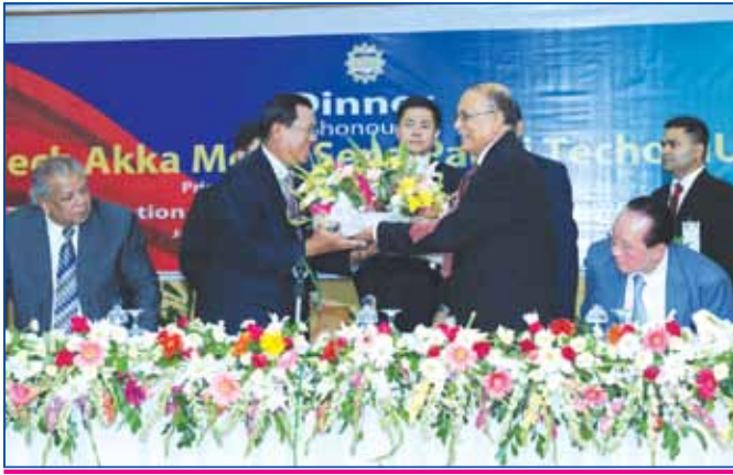
សម្តេចតេជោ ហ៊ុន សែន ចូលរួមក្នុងពិធីជប់លៀងដែលរៀបចំដោយ សហព័ន្ធសភាពាណិជ្ជកម្ម និងឧស្សាហកម្មបង់ក្លាដែស

កិច្ចព្រមព្រៀងពាណិជ្ជកម្មរវាងរាជរដ្ឋាភិបាលកម្ពុជា និងរដ្ឋាភិបាលនៃសាធារណរដ្ឋប្រជាមានិតបង់ក្លាដែស ដើម្បីពង្រីកកិច្ចសហប្រតិបត្តិការសេដ្ឋកិច្ច និងទំនាក់ទំនងពាណិជ្ជកម្មរវាងប្រទេសទាំងពីរ ។ សម្តេចតេជោ ហ៊ុន សែន បានស្នាគមន៍ចំពោះគោលបំណងរបស់បង់ក្លាដែស ក្នុងការរៀបចំពិធីរៀបចំបង់ក្លាដែសនៅកម្ពុជា ឆ្នាំ ២០១៥ ខាងមុខ ។ នាយករដ្ឋមន្ត្រីទាំងពីរបានបញ្ជាក់អំពីការចាំបាច់ពង្រឹងទំនាក់ទំនងរវាងសហគមន៍ធុរកិច្ចនៃប្រទេសទាំងពីរ ដោយលើកទឹកចិត្តវិស័យឯកជនឱ្យរៀបចំកិច្ចសម្របសម្រួលរវាងសភាពាណិជ្ជកម្មនៃប្រទេសទាំងពីរ ដើម្បីប្រើប្រាស់សក្តានុពលពាណិជ្ជកម្មទ្វេភាគី ហើយក៏បានសង្កត់ធ្ងន់ផងដែរទៅលើការធ្វើវិនិយោគទៅវិញទៅមក ។ ឯកភាពក្នុងការធ្វើឱ្យស្តីដំបូងទំនាក់ទំនងផ្នែកវប្បធម៌ អប់រំ រវាងប្រទេសទាំងពីរតាមរយៈកម្មវិធីផ្លាស់ប្តូរវប្បធម៌និងអប់រំដើម្បីធ្វើឱ្យប្រជាជននៃប្រទេសទាំងពីរកាន់តែយល់គ្នាថែមទៀត ។ លើកទឹកចិត្តឱ្យមានទំនាក់ទំនងកម្រិតខ្ពស់ ដើម្បីធ្វើឱ្យការយល់គ្នាទៅវិញទៅមក និងមិត្តភាព រវាងប្រជាជននៃប្រទេសទាំងពីរកាន់តែប្រសើរឡើង ជាពិសេសមន្ត្រីនយោបាយជាន់ខ្ពស់របស់រដ្ឋាភិបាល ក៏ដូចជារវាងបញ្ជីរដ្ឋ អ្នកសារព័ត៌មាន យុវជន កីឡាករ និងមន្ត្រីជំនាញវប្បធម៌ ។ល។