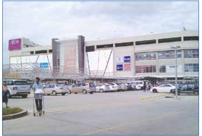
ផ្សារទំនើប អ៊ីអន នៅរាជធានីភ្នំពេញ