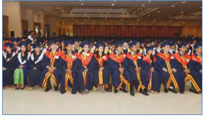
និស្សិតដែលមកទទួលសញ្ញាបត្រចាប់ពីថ្នាក់បរិញ្ញាបត្ររងដល់ថ្នាក់បណ្ឌិត

ក្រសួងបានពង្រឹង និងពង្រីកក្រុមប្រឹក្សាកុមារ និងយុវជននៅតាមគ្រឹះស្ថានសិក្សាគ្រប់កម្រិត ពង្រីកសកម្មភាពចលនាកាយវិទ្ធាជាតិកម្ពុជា ក្រុមយុវជនស្ម័គ្រចិត្តកាកបាទក្រហមកម្ពុជា នៅតាមសាលារៀន សមាគមនិស្សិតនៅតាមគ្រឹះស្ថានឧត្តមសិក្សា និងរៀបចំក្រុមយុវជនស្ម័គ្រចិត្តនៅថ្នាក់ជាតិ និងនៅថ្នាក់ក្រោមជាតិឱ្យបានល្អថែមទៀត ។ ក្រសួងក៏កំពុងរៀបចំផែនការសកម្មភាពសម្រាប់អនុវត្តគោលនយោបាយជាតិស្តីពីការអភិវឌ្ឍយុវជនកម្ពុជា សម្រាប់ជំរុញការ