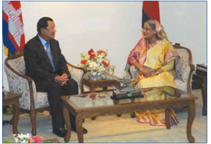
លោកជំទាវ ហ្សេន ហាន់ស៊ីណា និងសម្តេចតេជោ ហ៊ុន សែន ក្នុងកិច្ចសវនាការ

ចាប់ពីថ្ងៃទី ១៦-១៨ ខែមិថុនា ឆ្នាំ ២០១៤ សម្តេចអគ្គមហាសេនាបតី-តេជោ ហ៊ុន សែន នាយករដ្ឋមន្ត្រីនៃព្រះរាជាណាចក្រកម្ពុជា បានអញ្ជើញទៅបំពេញទស្សនកិច្ចនៅសភាព្រឹក្សាជាតិប្រជាមានិតបង់ក្លាដែស ។ នេះជាលើកទី១នៃដំណើរបំពេញទស្សនកិច្ចផ្លូវការរបស់សម្តេចតេជោនៅបង់ក្លាដែស បន្ទាប់ពីប្រទេសទាំងពីរបានភ្ជាប់ទំនាក់ទំនងការទូតជាមួយគ្នាកាលពីថ្ងៃទី ១៧ ខែកុម្ភៈ ឆ្នាំ ១៩៩៣ ។ គួរបញ្ជាក់ថា កាលពីខែមករា ឆ្នាំ ២០០១ លោកជំទាវ ហ្សេន ហាន់ស៊ីណា នាយករដ្ឋមន្ត្រីបង់ក្លាដែសបានដឹកនាំគណៈប្រតិភូជាន់ខ្ពស់អញ្ជើញមកបំពេញទស្សនកិច្ចផ្លូវការរយៈពេល៣ថ្ងៃនៅកម្ពុជា ។