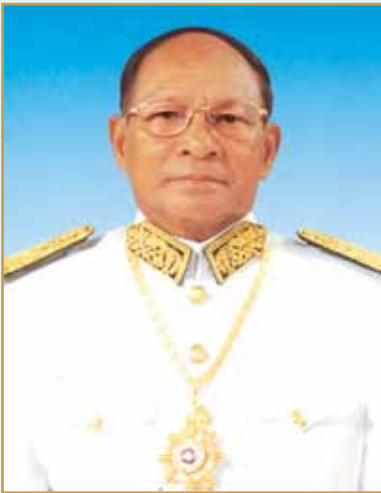
សម្តេចអគ្គមហាសេនាបតីតេជោ