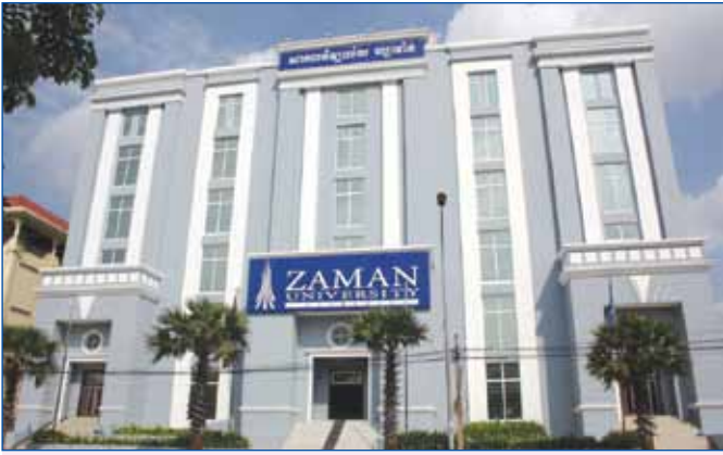
សាកលវិទ្យាល័យឯកជន zaman ក្នុងរាជធានីភ្នំពេញ