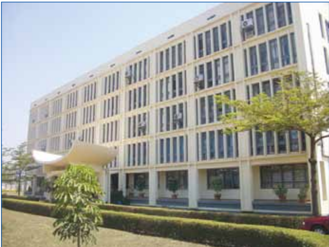
អគារនៃទីស្តីការក្រសួងអប់រំ យុវជន និងកីឡា

បច្ចុប្បន្ន អត្រាពិតនៃការសិក្សារបស់កុមារនៅបឋមសិក្សាសាធារណៈ និងឯកជន បានកើនដល់ ៩៨,២% (ស្រី ៩៨,៥%) និងមានសិស្សនិស្សិតនៅគ្រប់កម្រិតសិក្សាប្រមាណ ៣ លាន ៥ សែននាក់ ។ តាមចំនួន