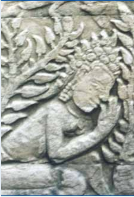
ចម្លាក់សំពះនៅជញ្ជាំងប្រាសាទបាយ័ន

ប្រមូលអារម្មណ៍ផ្តោតចិត្ត រួចហើយទើបលើក ដៃបន្ទូលជម្រាបទៅកាន់ទេវៈ ដែលនៅស្ថាន សួគ៌ បន្ទាប់មកទើបនាងហោងកាត់ពពកខ្ពស់ ទៅឆ្ងាយវិលទៅកាន់ស្ថានបរមសុខវិញ ។