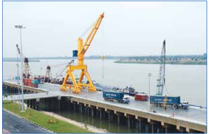
សកម្មភាពលើកដាក់ទំនិញនាំចេញ-នាំចូល នៅកំពង់ផែរាជធានីភ្នំពេញ ស្ថិតក្នុងស្រុកកៀនស្វាយ ខេត្តកណ្តាល

រាជរដ្ឋាភិបាលកម្ពុជានិតិកាលទី ៥ ដឹកនាំដោយសម្តេចអគ្គមហាសេនាបតីតេជោ ហ៊ុន សែន ដែលបានប្រសូតចេញពីឆន្ទៈប្រជាពលរដ្ឋធ្វើការបោះឆ្នោតកាលពីថ្ងៃទី ២៨ ខែកក្កដា ឆ្នាំ ២០១៣ បានចេញដំណើរលើមូលដ្ឋានដែលសេដ្ឋកិច្ចជាតិកំពុងបង្ហាញនូវភាពរឹងមាំឆ្ពោះទៅសម្រេចគោលដៅកំណើនសេដ្ឋកិច្ច ៧% ប្រកបដោយចីរភាព ។