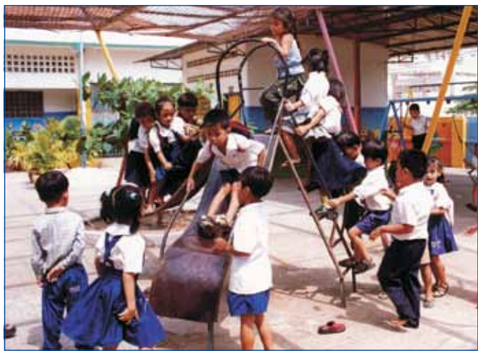
សិស្សកម្រិតមត្តេយ្យសិក្សា

ជាមួយនឹងការចាប់ផ្តើមអនុវត្តនូវយុទ្ធសាស្ត្រចតុកោណដំណាក់កាលទី ៣ របស់រាជរដ្ឋាភិបាលនីតិកាលទី ៥ វិស័យអប់រំកំពុងឈានចូលរបត់ថ្មីផងដែរ ។ ក្នុងគោលបំណងលើកកម្ពស់គុណភាពវិស័យអប់រំ ក្រសួងអប់រំ យុវជន និងកីឡា បានដាក់ចេញនូវវិធានការមួយចំនួនដើម្បីធ្វើកំណែទម្រង់វិស័យអប់រំដោយឈរលើមូលដ្ឋាននៃយុទ្ធសាស្ត្រចតុកោណនិងផែនការយុទ្ធសាស្ត្រវិស័យអប់រំ២០១៤-២០១៨ គឺការពង្រឹងការគ្រប់គ្រងហិរញ្ញវត្ថុ និងការគ្រប់គ្រងទ្រព្យសម្បត្តិរដ្ឋការពង្រឹងការគ្រប់គ្រងបុគ្គលិក ការពង្រឹងការប្រឡងគ្រប់ប្រភេទការបង្កើតធនាគារខួរក្បាលវិស័យអប់រំ កំណែទម្រង់ឧត្តមសិក្សា ការបង្កើនគុណភាព និងប្រសិទ្ធភាពនៃសេវា អប់រំនៅគ្រប់កម្រិតសិក្សា ការអភិវឌ្ឍសម្រាប់យុវជននូវជំនាញបច្ចេកទេស និងជំនាញទំនាក់ទំនងការងារអប់រំកាយ និងកីឡា ។ នៅក្នុងផែនការយុទ្ធសាស្ត្រវិស័យអប់រំឆ្នាំ២០១៤-២០១៨ ក៏បានផ្តោតការយកចិត្តទុកដាក់ខ្ពស់ផងដែរលើការពង្រីកការអប់រំកុមារតូច ការបង្កើនលទ្ធភាពទទួលបានការអប់រំនៅកម្រិតមធ្យមសិក្សា និងក្រោយមធ្យមសិក្សាប្រកបដោយគុណភាព ព្រមទាំងការពង្រីកការងារអប់រំក្រៅប្រព័ន្ធ និងការអប់រំបច្ចេកទេស ។/