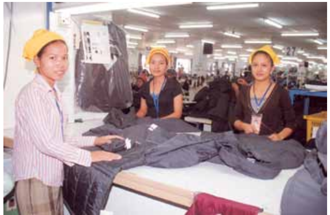
កម្មការិនីនៃរោងចក្រកាត់ដេរសម្លៀកបំពាក់មួយកន្លែង ក្នុងរាជធានីភ្នំពេញ