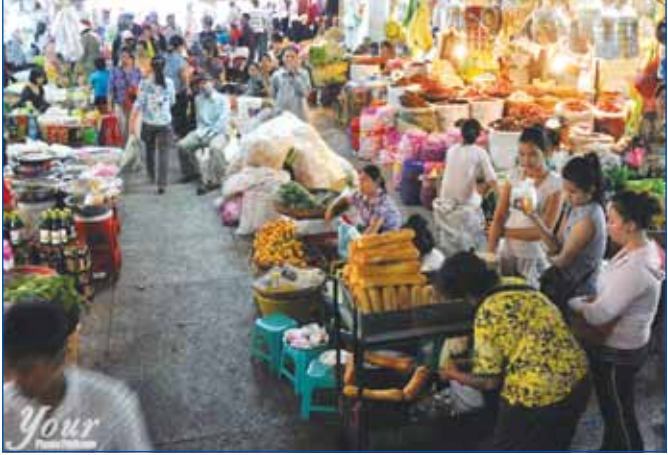
សកម្មភាពមហាព្យាបាលសំអាងនៅតាមទីផ្សារនានា ក្នុងរាជធានីភ្នំពេញ

បើធៀបនឹងរយៈពេលដូចគ្នាឆ្នាំ ២០១៣ ។ ដោយឡែក ពាណិជ្ជកម្ម កម្ពុជា អាមេរិក តាមទិន្នន័យចុងក្រោយបង្ហាញថា ការស្ទុះងើបឡើង វិញនៃសេដ្ឋកិច្ចអាមេរិក បានជំរុញឱ្យការនាំចូលពីកម្ពុជា បានកើន ឡើង ១១ % ក្នុងអំឡុងត្រីមាសទី ១ នៅឆ្នាំនេះ ។ ការនាំចូលរបស់ អាមេរិកពីកម្ពុជាមានតម្លៃសរុប ៧៧១ លានដុល្លារនៅចុងខែមីនា កើនឡើងពី ៦៩៤ លានដុល្លារក្នុងរយៈពេលដូចគ្នាកាលពីឆ្នាំមុន ។ លទ្ធផលនេះបានធ្វើឱ្យកម្ពុជាស្ទុះឡើងដល់ចំណាត់ថ្នាក់ទី ៥៨ នៅលើ បញ្ជីនៃបណ្តាប្រទេសដែលនាំចូលទៅអាមេរិក ។/