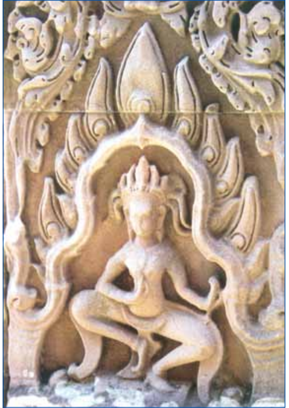
រាំអប្សរា និងចម្លាក់អប្សរានៅលើជញ្ជាំងប្រាសាទអង្គរវត្ត ខេត្តសៀមរាប

ទំនៀមទម្លាប់ប្រពៃណីខ្មែរបានប្រកាន់ យករបបមាតាធិបតេយ្យ ហើយតែងមាន ជំនឿថាស្រ្តីគឺជាអ្នកនាំមកនូវសិរីមង្គល ។ ចំណែកនាងទេពសុទ្ធតែជាស្រ្តីបរិសុទ្ធ នាងជា អ្នកតំណាងសុំក្តីប្រោសប្រណីពីអាទិទេព ឬវត្ថុ ស័ក្តិសិទ្ធិ ហើយពាំនាំពរពីស្ថានសួគ៌មកវិញនូវ សេចក្តីសុខចម្រើន ក្សេមក្សាន្តដូនប្រជារាស្ត្រ និងប្រទេសជាតិ ។