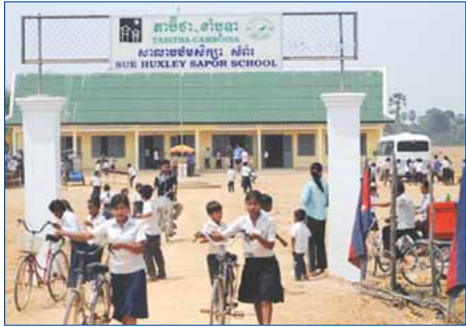
សិស្សានុសិស្សនៃសាលារបស់សិក្សាសំព័រ ក្នុងព្រះរាជាណាចក្រកម្ពុជា