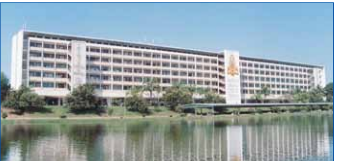
សាលាវិទ្យាល័យភូមិន្ទភ្នំពេញ

ក្នុងការលើកកម្ពស់គុណភាព និងប្រសិទ្ធភាពអប់រំ ក្រសួងអប់រំ យុវជន និងកីឡា បានកែលម្អកម្មវិធីសិក្សា និងផ្តល់សៀវភៅសិក្សា