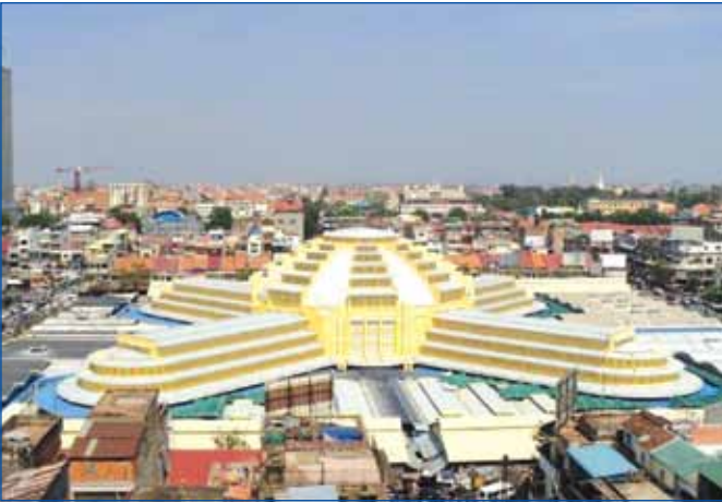
ផ្សារថ្មី នៅរាជធានីភ្នំពេញ