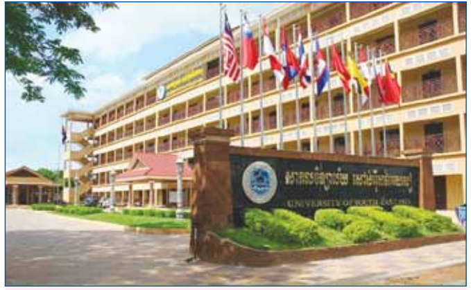
សាកលវិទ្យាល័យឯកជន ក្នុងខេត្តសៀមរាប

សម្ភារៈបច្ចេកទេស ដើម្បីបម្រើឱ្យការរៀន ការបង្រៀន និងការស្រាវជ្រាវនៅតាមគ្រឹះស្ថានសិក្សា និងបានយកចិត្តទុកដាក់ដល់ការងារតម្រង់ទិសវិជ្ជាជីវៈនៅតាមវិទ្យាល័យ ចំណេះទូទៅ និងបច្ចេកទេស ។