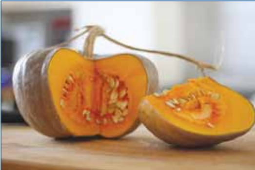
ផ្លែឆ្កែវផ្តល់សារសំខាន់ដល់សុខភាពមនុស្ស